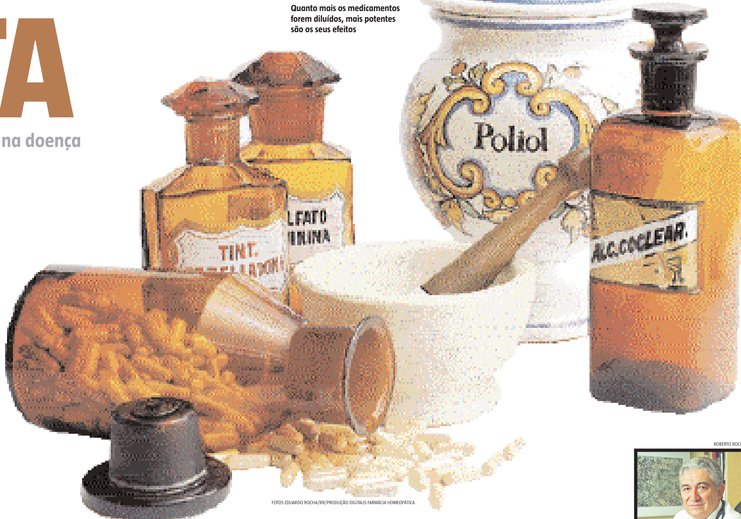
Quanto mais os medicamentos forem diluídos, mais potentes são os seus efeitos

Ela considera o mais importante na homeopatia é o bem-estar que ela proporciona: "Sempre que tenho um problema em casa ou no trabalho, que engulo algum sapo, a minha garganta estoura na hora. Então, tomo o meu remédio homeopático, que me faz lidar melhor com os problemas, seja em casa, no trabalho, nos relacionamentos e até comigo mesma".